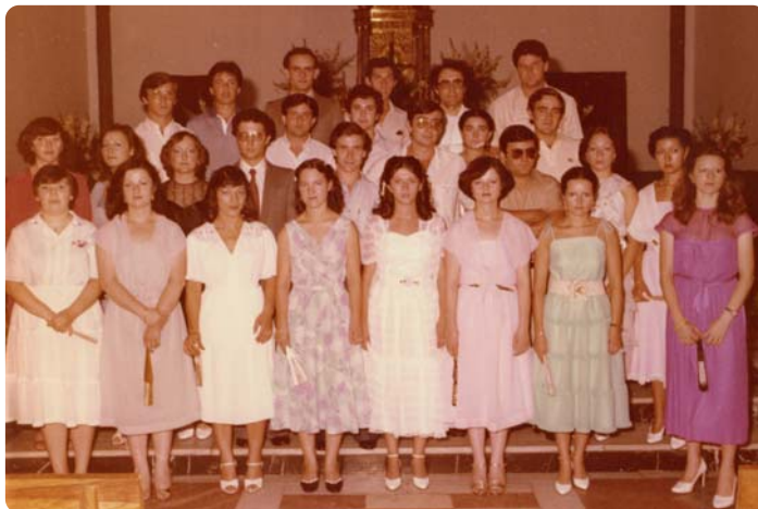
Festers de Faura. Any 1981

A les 18,00h. Primera semifinal del Trofeu de Festes d'Agost de pilota entre els equips d'Almenara i Beniparrell, al carrer Mariano Benlliure. ( ● )