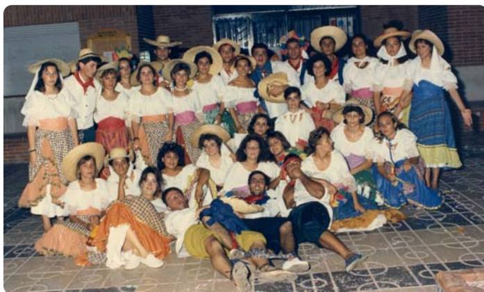
Cavalcada de festes. Any 1988

A les 01,00h. Ball amenitzat per l'orquestra "MÓDENA" ( ▲ )