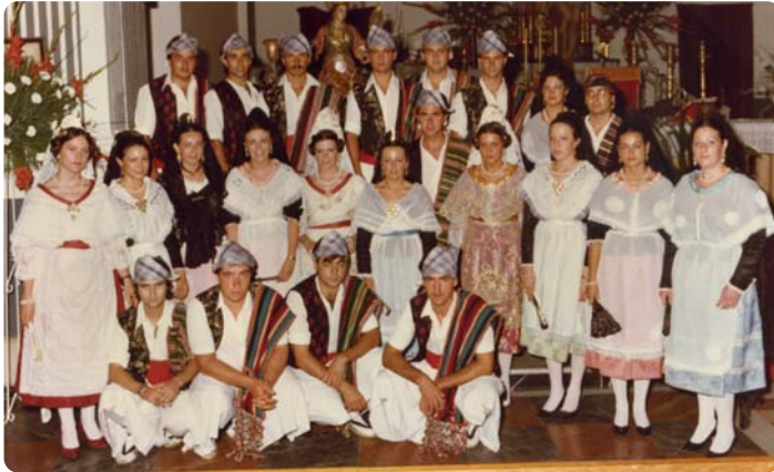
Festers de Faura després de la Baixà. Any 1984

A l'1,30h. Al parc de la canaleta, Macroffesta de la cervesa amb karaoke i go-go's. (▲)(●)